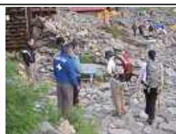
山岳パトロール活動