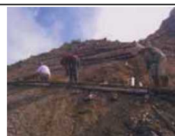
登山道や遊歩道の整備