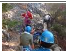
民間救助隊員の訓練や装備品