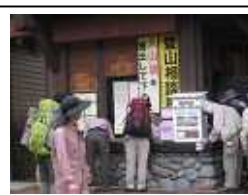
登山口での案内相談