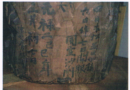
▲十一面観音像の背銘