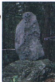
▲播隆名号碑（志賀谷）