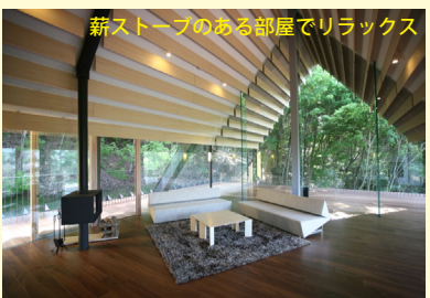
薪ストーブのある部屋でリラックス