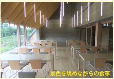
景色を眺めながらの食事