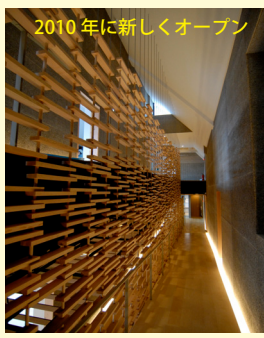
2010年に新しくオープン