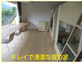
キレイで清潔な宿泊室